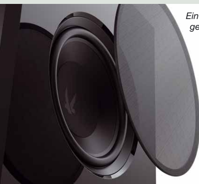
Ein fein gelochtes Schutzgitter aus Metall gehört zum Lieferumfang

Pegel bis 110 dB stellen den Arendal vor keine Probleme, erst oberhalb 110 dB machen sich die physikalischen Grenzen des Subwoofers bemerkbar.