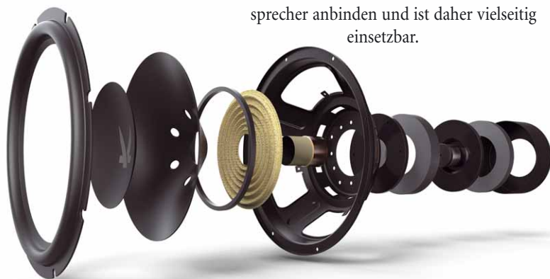
Der massive Magnetantrieb, eine große Schwingspule und eine resonanzarme, stabile Membran verleihen dem Arendal-Subwoofer maximalen Dynamikumfang

Mit beachtlicher tiefer Grenzfrequenz von 20 Hertz sorgt der 1723 Subwoofer 1 im Messlabor für Begeisterung, vorausgesetzt der Equalizer steht in Stellung 1. Etwas weniger tief, bis etwa 35 Hertz, reicht die Performance in Stellung EQ 2. In beiden Fällen neigt der Arendal Woofer allerdings zu einem kleinen „Peak“ bei 45 Hertz, was in der Praxis in realen Hörräumen jedoch in der Regel sehr angenehm und „satt“ ohne zu dröhnen klingt. Fordert man den Arendal 1723 Subwoofer 1 zu höheren Pegeln heraus, liefert er klaglos und wie aus dem Ärmel geschüttelt brachiale Bassgewalt bis 110 dB. Erst bei Extremlautstärken über 110 dB lassen sich Kompressionserscheinungen im Tiefbass ausmachen, allerdings dürften schon lange vor Erreichen dieser Grenzen die Doppelhausnachbarn Sturm laufen. Im Heimkino sorgt der 1723 Subwoofer 1 für jede Menge Spaß, denn seine knackige und präzise Art, Bassimpulse in den Hörraum zu schleudern, kann begeistern. Absolut dröhnfrei und physikalisch spürbar erweitert der Arendal das Frequenzspektrum jeder Anlage deutlich nach unten. Er lässt sich zudem recht einfach an vorhandene Lautsprecher anbinden und ist daher vielseitig einsetzbar.